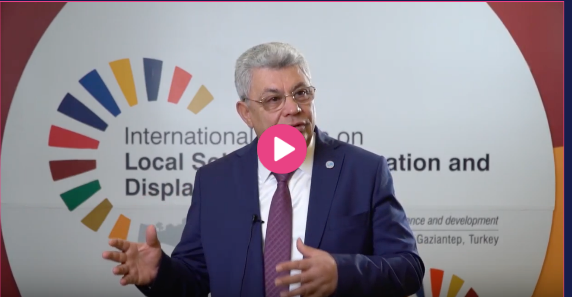
Mohamad Saadieh / Deirnbouh Belediye Başkanı, Lübnan / UCLG-MEWA Başkanı / Dinniyeh Bölgesi Belediyeler Birliği Başkanı